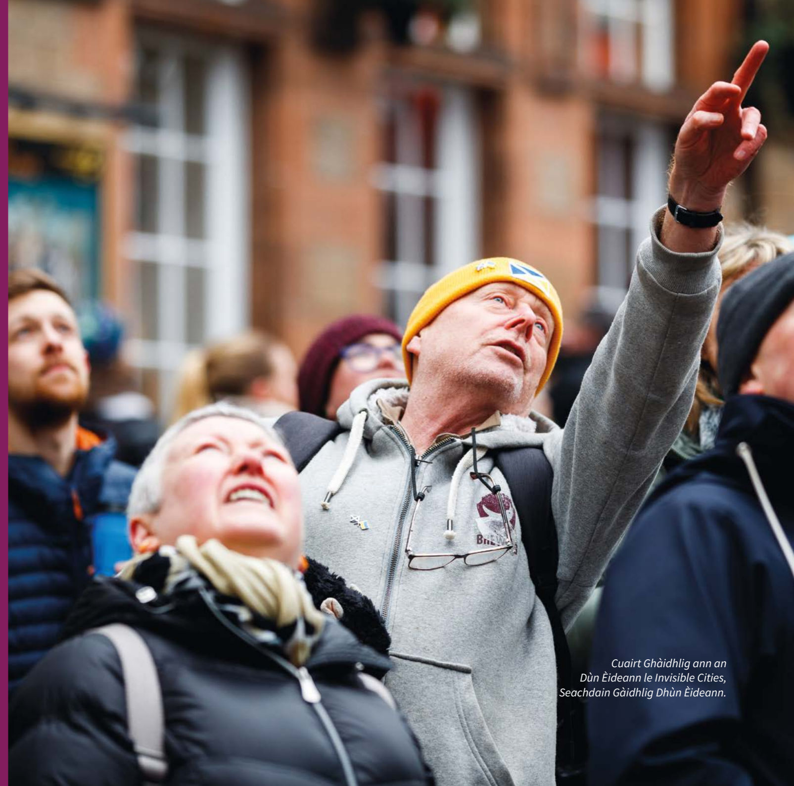
Cuairt Ghàidhlig ann an Dùn Èideann le Invisible Cities, Seachdain Ghàidhlig Dhùn Èideann.