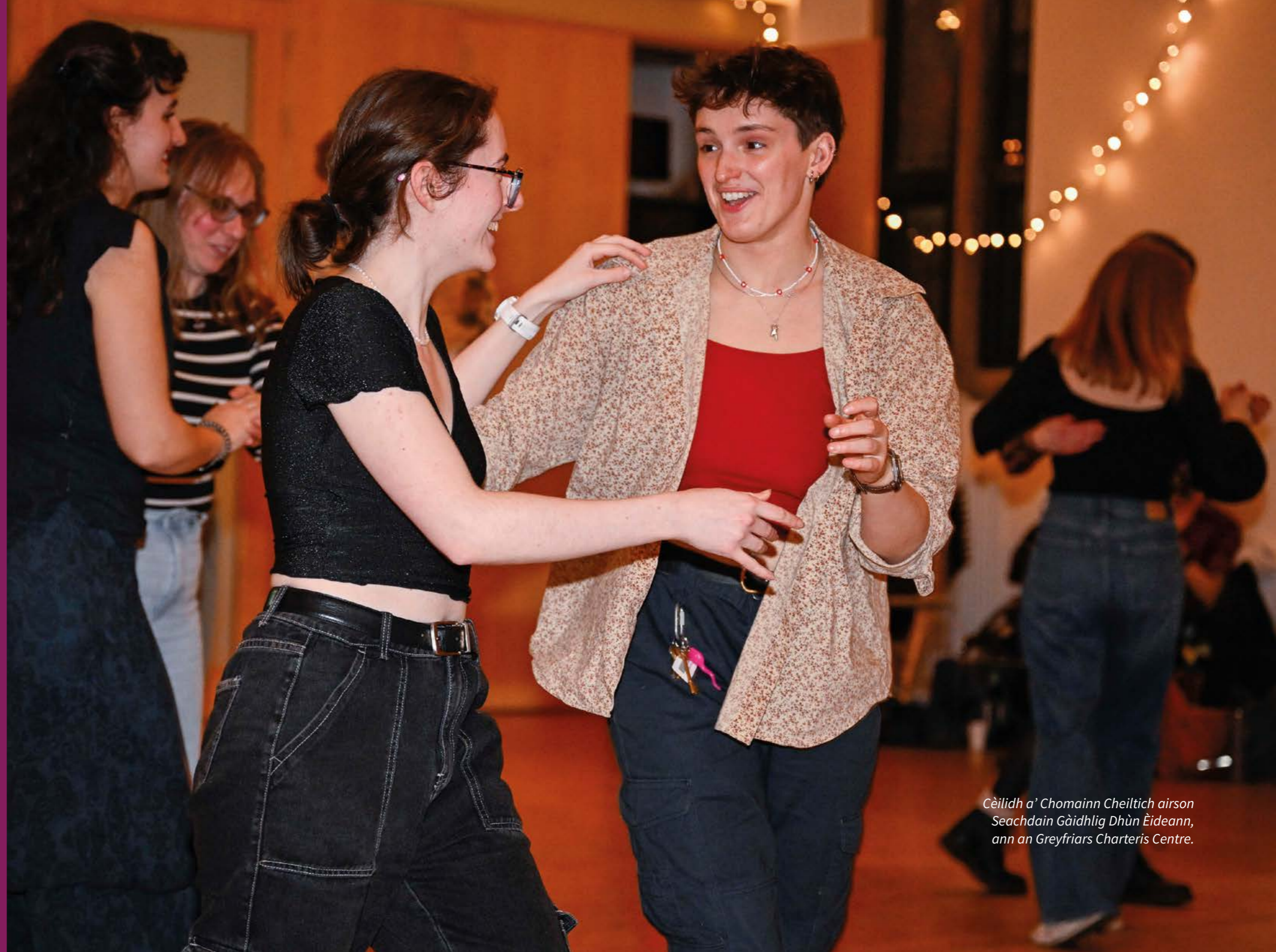
Cèilidh a’ Chomainn Cheiltich airson Seachdain Gàidhlig Dhùn Èideann, ann an Greyfriars Charteris Centre.

Tha sreath de gheallaidhean nam bunait aig gach aon de na còig prionnsapalan nar Plana Gàidhlig.